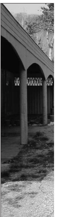
TIL LEG – Der er o