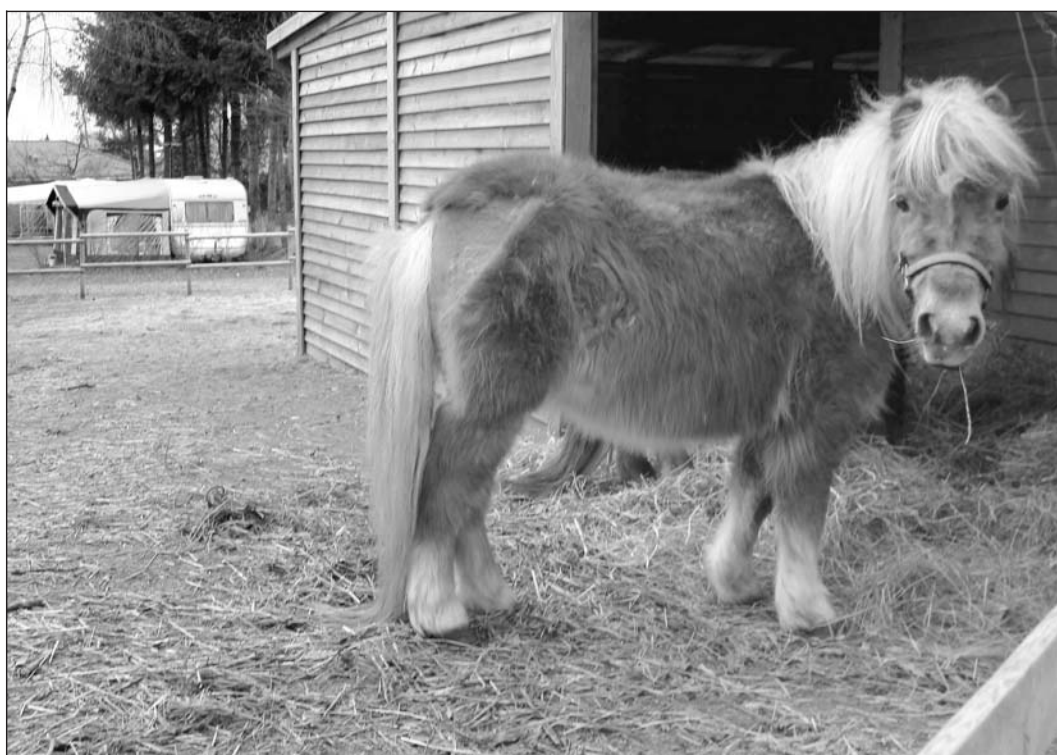
SOMMERHIT – Tarzan har en rolig tid lige nu. Men det vil snart ændre sig.