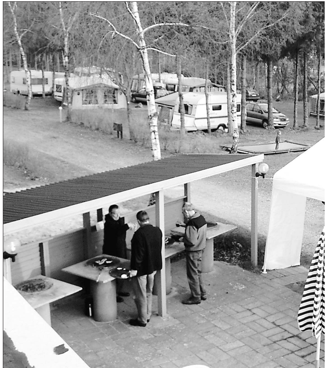
LIV – 45 års fødselsdagen blev et tilløbsstykke – og hoppepuden kom i brug.

Selv om Auning Camping lige har fejret 45 års jubilæum, er pladsen ikke så kendt blandt campister. Men i 2003 kom et nyt værtspar til, der har sat den på Danmarkskortet og skabt et feriested for især børnefamilier, der vil have rolige, enkle og velholdte omgivelser og mange aktivitetsmuligheder i området.